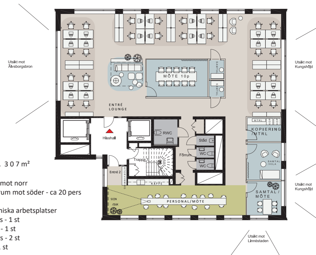
PLAN 16 ca. 307m 2

Entré och lounge mot norr Separat personalrum mot söder - ca 20 pers